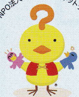
キャラクター:こっこじさん